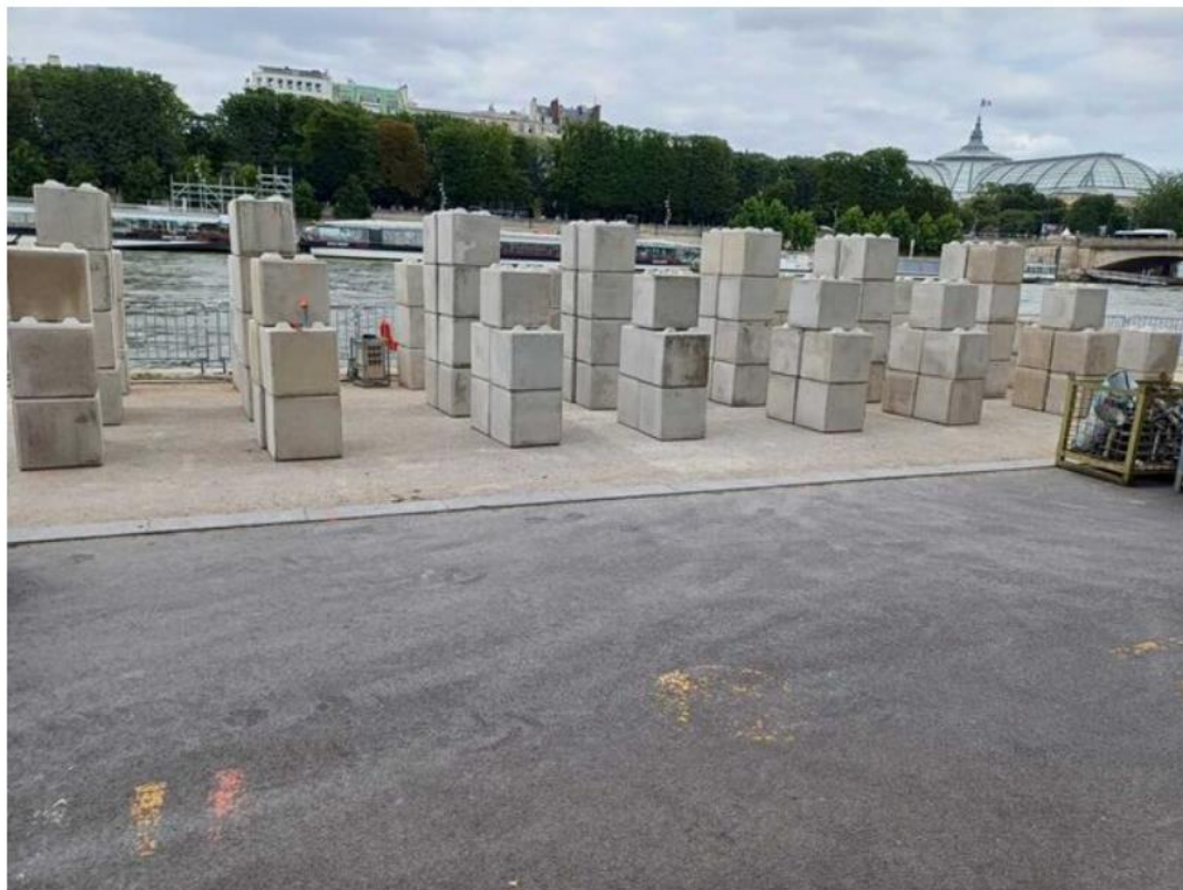
Essai de tassement sur le quai du Gros Caillou

Lorsque nous avons travaillé sur le quai du Gros Caillou, sur la rive gauche de la Seine, la production nous a une nouvelle fois surpris. Pour nous assurer de la capacité de portance du quai, nous souhaitions en plus des calculs mener un essai de tassement sur le bord, sur une zone de 20 m. Ni une, ni deux, les équipes de Paname 24 sont venues un matin avec 80 t de béton pour faire observer par le géomètre de l'opération durant 6h les tassements verticaux. Grâce à ces essais, nous avons pu nous rapprocher au plus près du bord pour que les spectateurs aient la meilleure courbe de vue possible, c'est à dire à 2 m du bord alors que dans nos premières analyses nous partions sur une distance de 10 m.