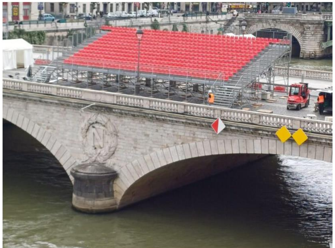
Montage des tribunes sur le pont au Change

Pour ce qui est du pont de la Tournelle construit au début du XXe siècle, nous avons bénéficié là encore d'un accès riche aux archives, dans lesquelles nous avons retrouvé des photos de chantier et des plans d'exécution. Fort de ces documents, nous avons réalisé un calcul à partir des règles sur le béton armé en vigueur à cette époque, que nous avons comparées avec un contre-calcul basé sur l'Eurocode 2 actuel, relatif au calcul des structures en béton.